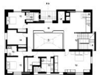
Κάτοψη α' ορόφου

Άλλα σημαντικά στοιχεία του βιοκλιματικού σχεδιασμού είναι η εξωτερική θερμομόνωση με πετροβάμβακα πάχους 9 cm και η πλήρης απουσία θερμογεφυρών, οι ενεργειακοί υαλοπίνακες low - e (κάποιοι με ενσωματωμένες περσίδες), η χρήση ανακυκλωμένων και ψυχρών υλικών, η εγκατάσταση solar tubes για το ζεστό νερό χρήσης και η μεγάλη δεξαμενή ομβρικών.