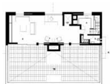
Κάτοψη β' ορόφου